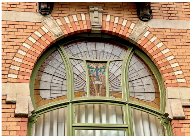
Maison Langbehn

Rdv : 4 avenue Palmerston, 1000 Bruxelles 1h30 / 25€